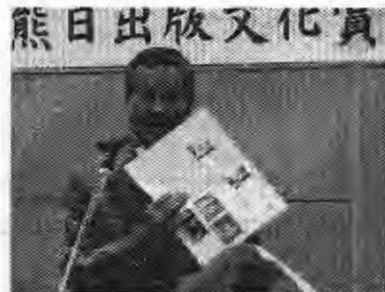
「熊日出版文化賞」 祝賀会の様子