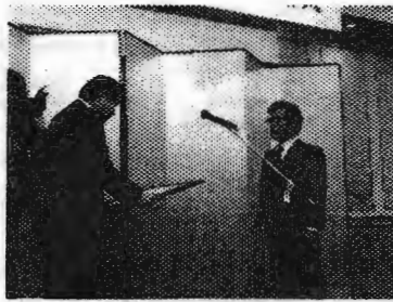
「熊日出版文化賞」 受賞風景と 受賞作品の 展示風景